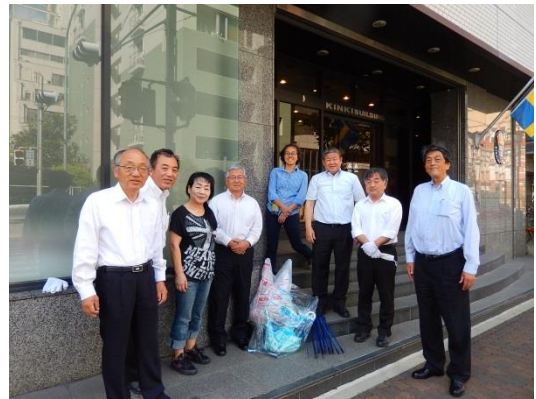
地下鉄みなと元町駅周辺清掃