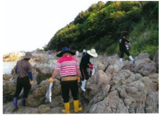
南あわじ漁協と漁協女性部 漁港周辺