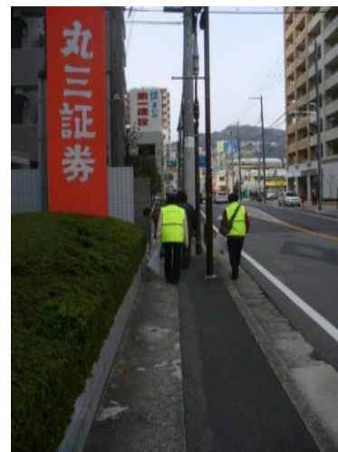
春季クリーンアップ時