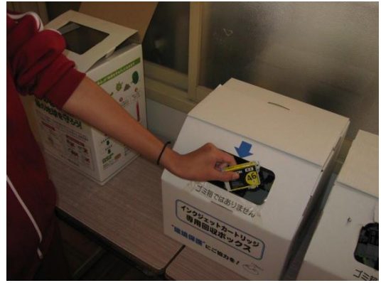
インクカートリッジ回収