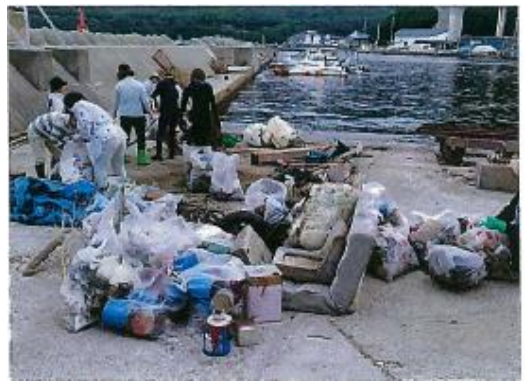
室津漁協女性部 室津漁港周辺(1)