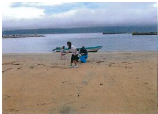
沼島漁協女性部 沼島海水浴場