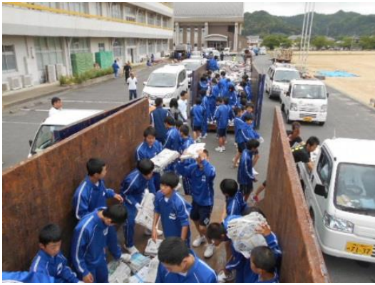
洲本市立洲浜中学校