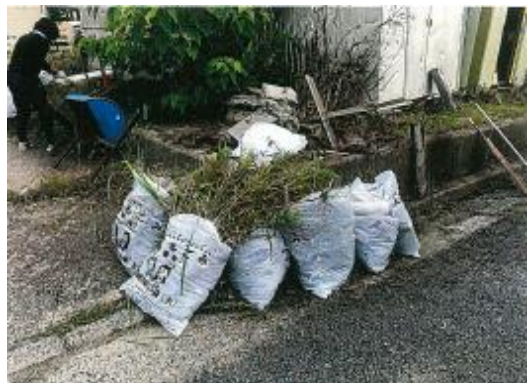
津名(塩田)漁協女性部 塩田荷捌所周辺