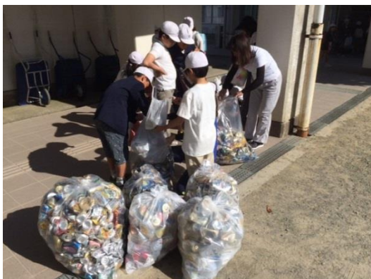
稲美町立天満小学校