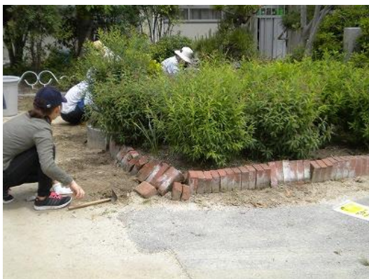
教職員・PTA執行部及び地域住民による、校内中庭の草抜き作業