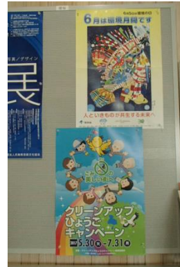
ポスター掲示（庁舎ロビー）