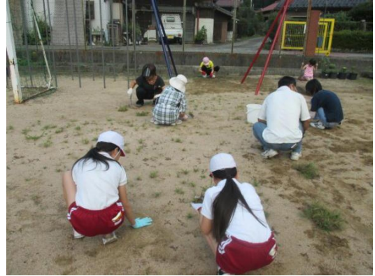
PTA 奉仕作業（保護者と協力して除草作業）