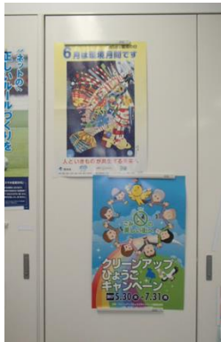
ポスター掲示（課室出入口）