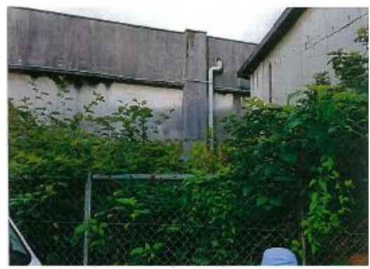
室津漁協女性部 室津漁港周辺(2)