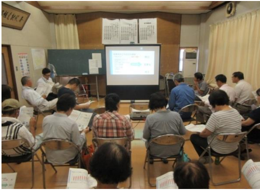
ごみ減量・リサイクル懇談会