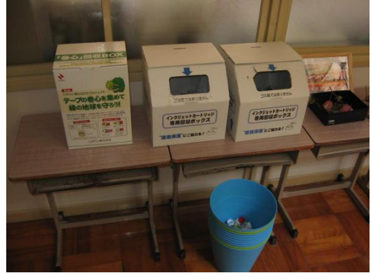
リサイクル回収活動